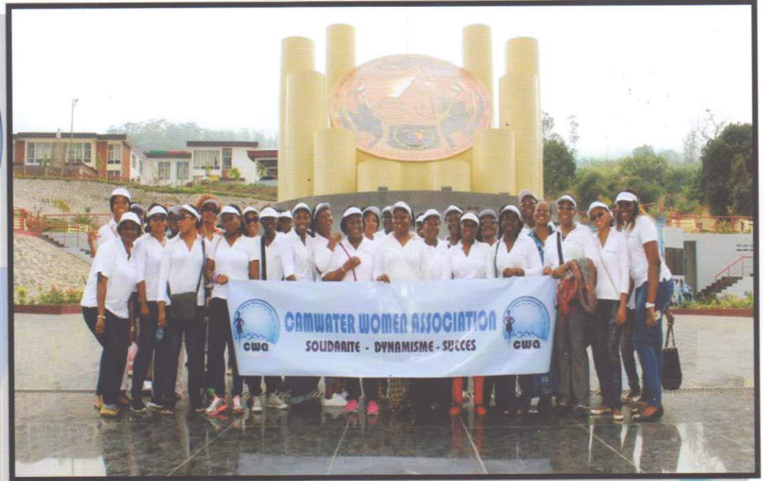
Les membres de l'association CWA à la place du cinquantenaire-BUEA

La Camwater Women Association est une association apolitique non gouvernementale régie par la Loi N°9053 du 19-12-1990 portant liberté d'Association en République du Cameroun. Cette association a pour objectif: